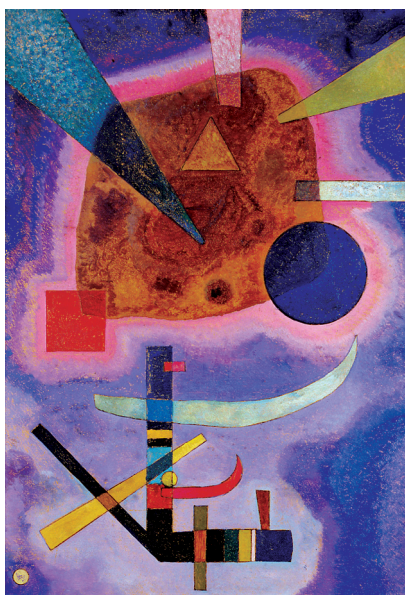
Vassily KANDINSKY , Drei Elemente ( Trois éléments ), 1925 – MAMCS