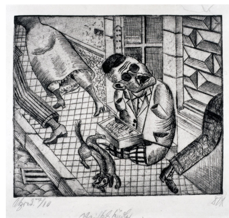
Otto DIX , Streichholzhändler ( Marchand d'allumettes ), 1921, Pointe sèche – MAMCS