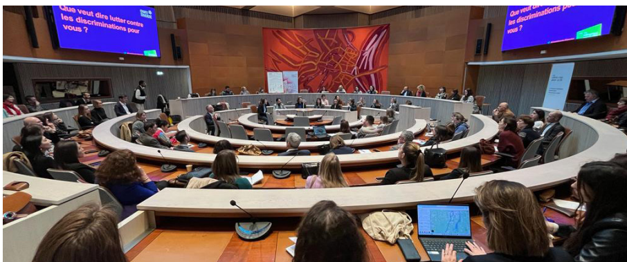
Tour de France de la Diversité – Strasbourg Mars 2023 Charte de la Diversité