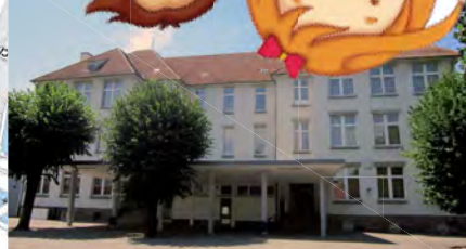
École élémentaire République lun. mar. jeu. ven. 8h30 - 12h00 / 14h00 - 15h45 mer. 8h30 - 11h30