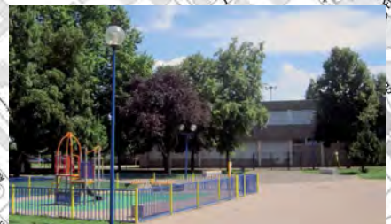
École élémentaire At Home lun. mar. jeu. ven. 8h30 - 12h00 / 14h00 - 15h45 mer. 8h30 - 11h30