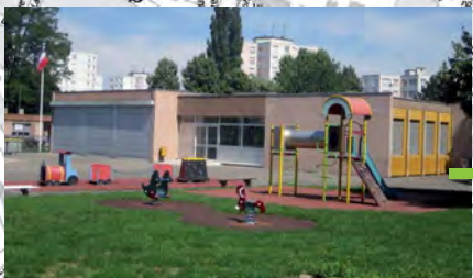
École maternelle At Home lun. mar. jeu. ven. 8h40 - 11h50 / 13h50 - 15h55 mer. 8h40 - 11h40