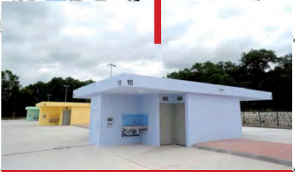
Aire d'accueil Gens du voyage