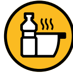
Huile de friture