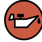
Huile de vidange