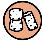
Bouchons en liège