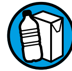
Bouteilles en plastique, briques alimentaires