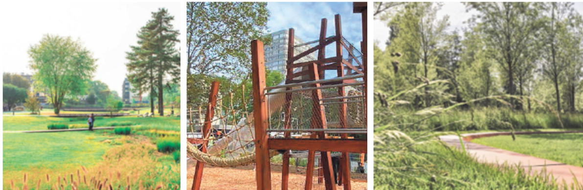
Illustrations de principe du futur parc