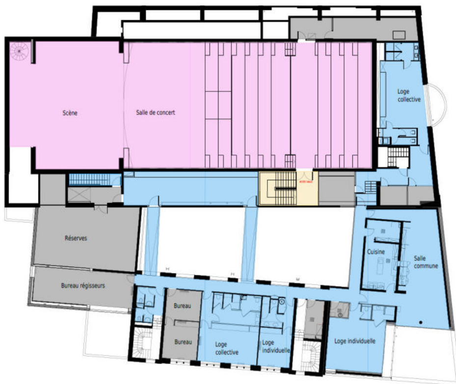
PLAN R+1 1/50