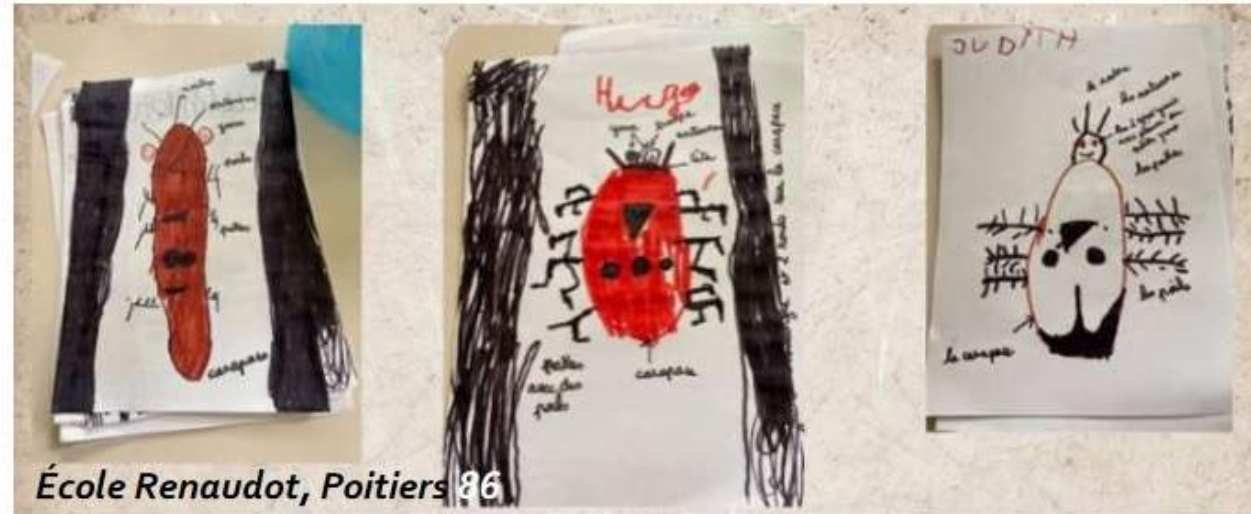
École Renaudot, Poitiers 86

Ecole Renaudot, participante de la Recherche-Action « Grandir avec la nature »