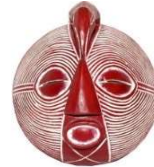
Masque africain bazangwé, RDC