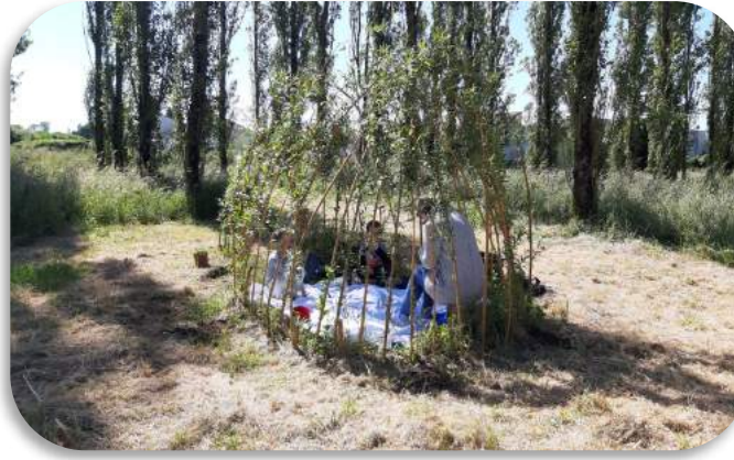
Proposer des aménagements adaptés