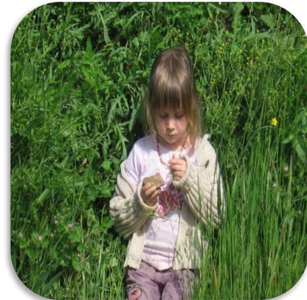
Ritualiser certaines activités