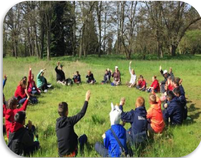
Favoriser la verbalisation des expériences