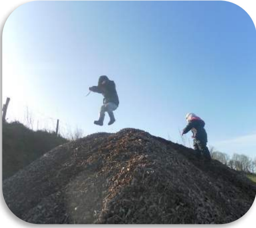
Offrir des temps de jeu libre