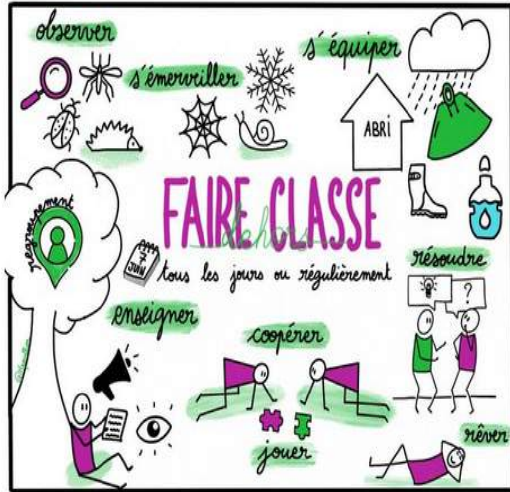
Illustration : Sketch kit Canopé Les essentiels pour faire classe dehors