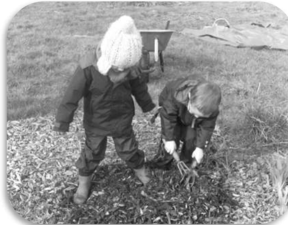
Laisser le temps de l'exploration