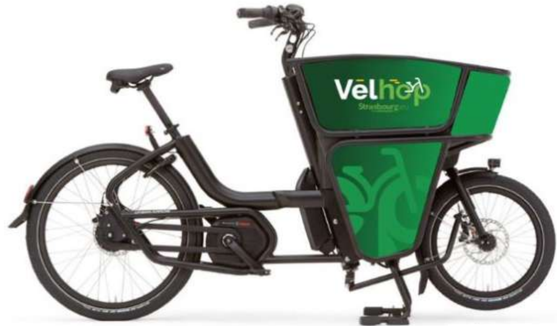
Vélo Cargo Compact