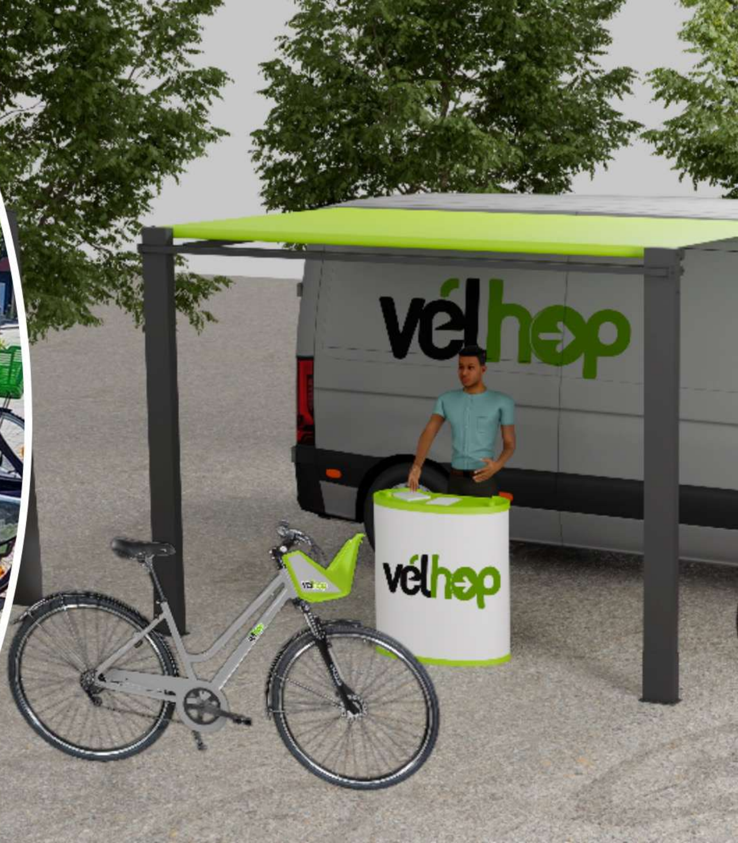
Les agences mobiles