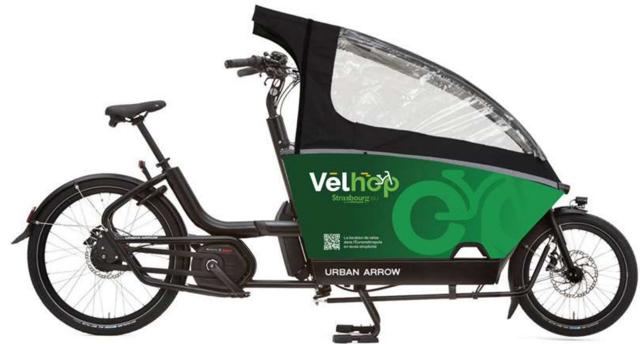
Vélo Cargo Biporteur