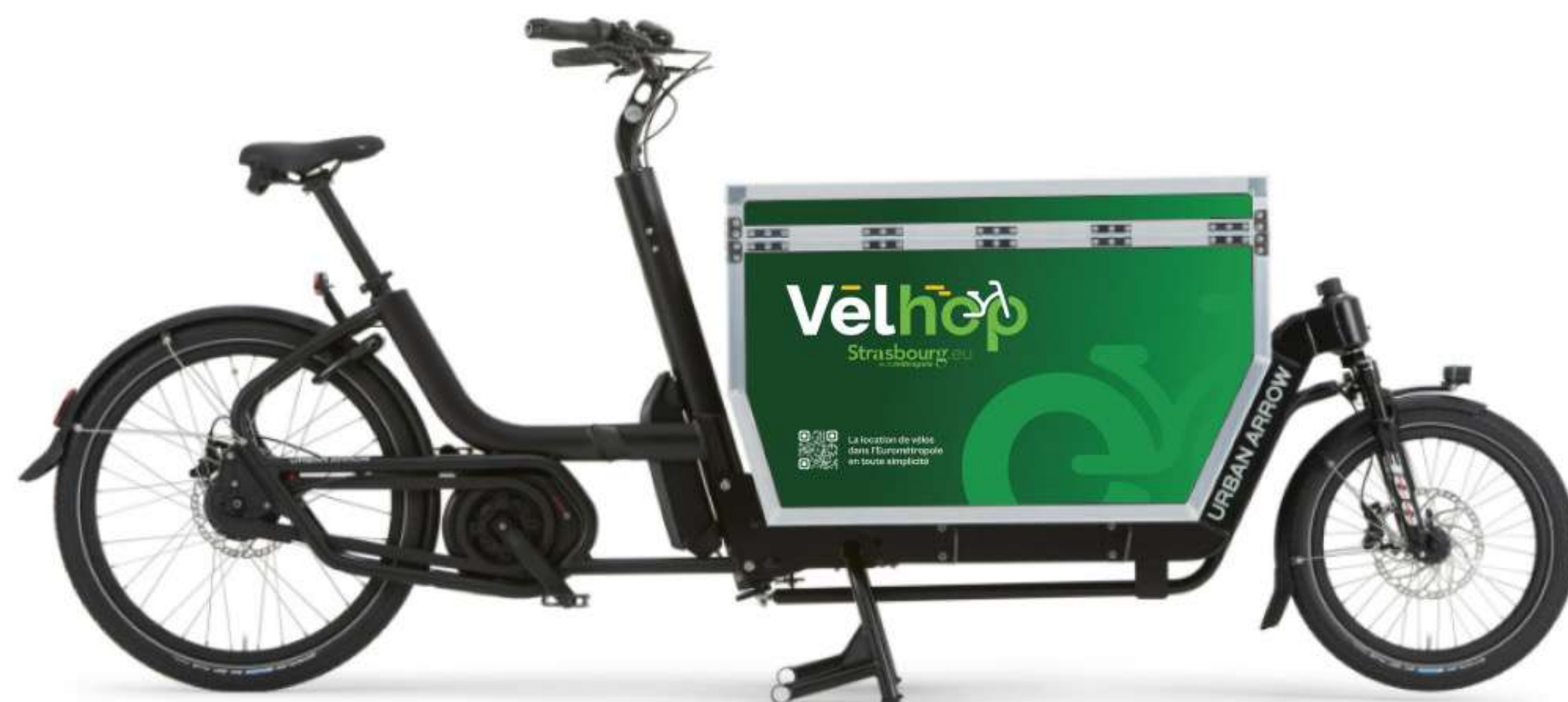
Vélo Cargo Pro