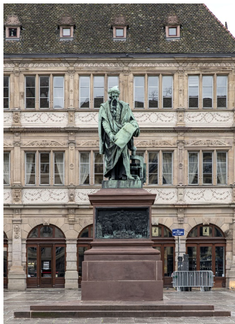
Place Gutenberg.