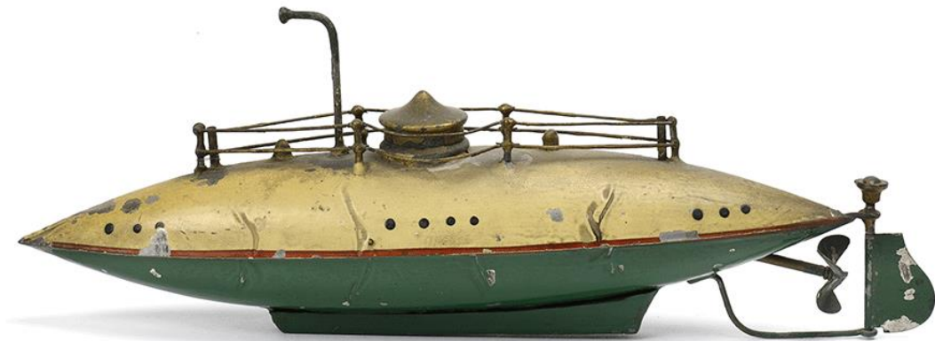
Sous-marin attribué à Georges Carette, Paris, vers 1905.

L'artiste s'est souvent référé à sa collection de jouets pour transposer graphiquement nombre d'entre eux dans ses livres pour enfants, notamment dans Le Chapeau volant , Les histoires farfelues de Papaski et La Grosse Bête de Monsieur Racine .