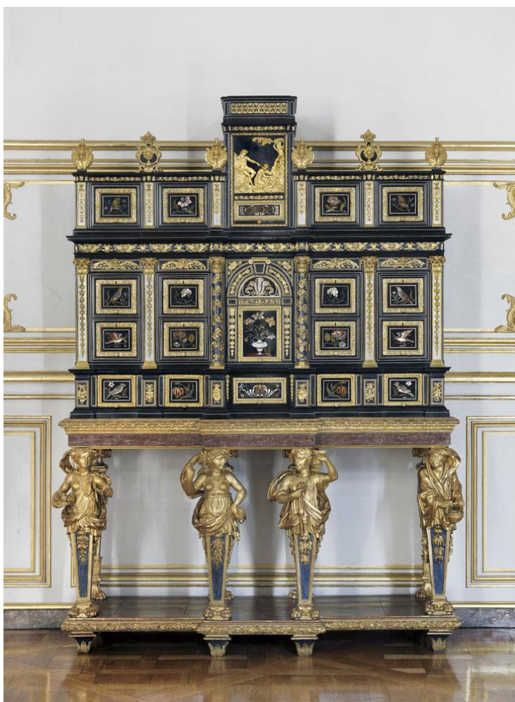
Cabinet, atelier parisien, vers 1675.

Armoires, coffres et crédences de style rhénan cèdent alors la place à des meubles de construction plus légère tels que commodes, chaises, fauteuils fonceés de canne, consoles et secrétaires de style Régence, Louis XV, puis néo-classique.