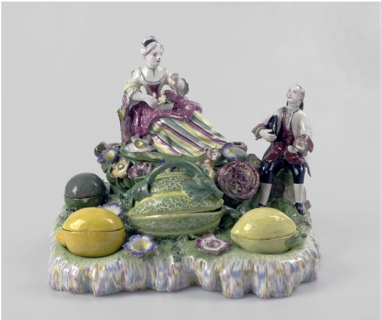
Encrier, manufacture Paul Hannong, entre 1748 et 1754, faïence polychrome.

La manufacture de céramiques est particulièrement renommée pour ses décors de « fleurs fines » et ses terrines en trompe-l'œil, à la verve naturaliste inégalée dans toute l'Europe. Les pièces de forme comptent parmi les pièces les plus spectaculaires.