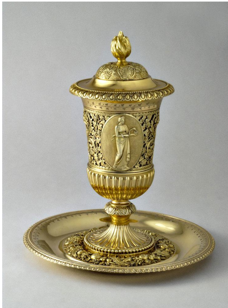
Coupe couverte avec présentoir, Jacques Frédéric Kirstein, 1815, argent doré.

La cohérence et la richesse de la collection contribuent au caractère exceptionnel de cet ensemble, symbole d'un savoir-faire et d'un art de vivre raffinés, que vient compléter le précieux fonds de dessins d'orfèvrerie conservé au Cabinet des Estampes et des Dessins de Strasbourg.