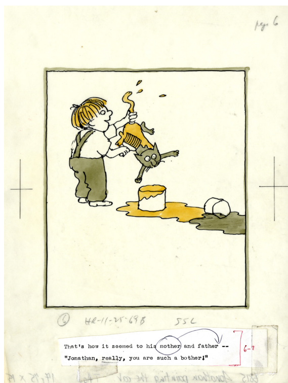
Tomi Ungerer, dessin pour That Pest Jonathan , 1970 © Diogenes Verlag AG, Zürich / Tomi Ungerer Estate

Exemple : ... lancent un lasso pour hisser le totem jusqu'à eux.