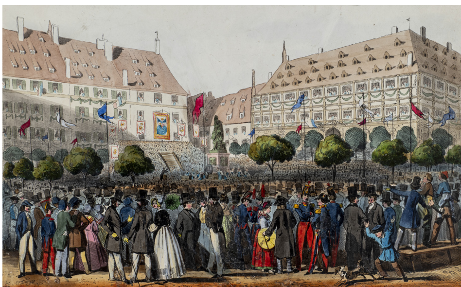
Inauguration du monument à Gutenberg - Cortège-industriel- Lithographie de Gluck 1840

L'animation GUTENBERG, UNE RÉVOLUTION propose un parcours de la trace écrite à l'imprimé dans les collections permanentes du musée.