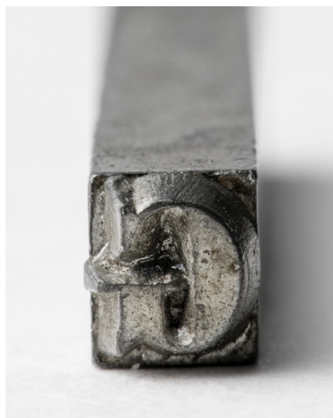
Caractère-imprimerie -Initiale de Gutenberg. BNU.