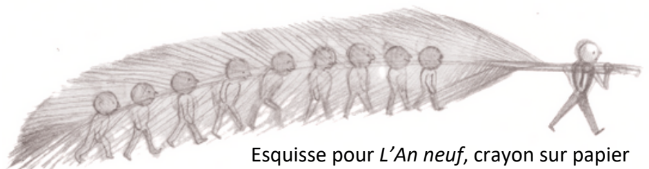
Esquisse pour L'An neuf , crayon sur papier © Caroline GAMON / Dossier de candidature

Ce projet tente d'apporter un regard amusé sur une société fantasque quelque peu fermée, dans laquelle tout se doit de rester inchangés et sans clore l'histoire sur une leçon finale afin d'imaginer le devenir de cette société libre à l'interprétation du lecteur.