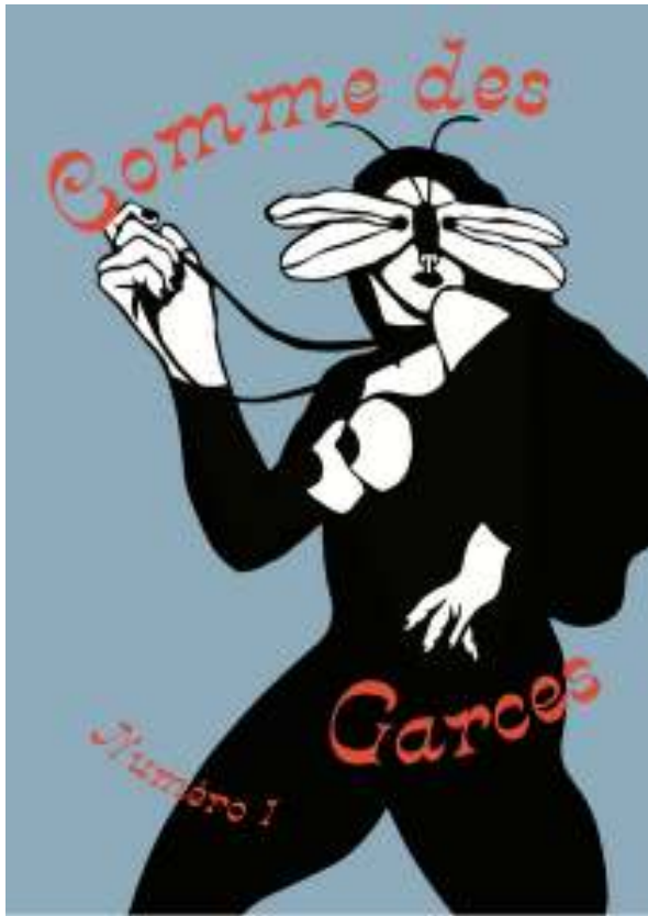
Couverture et extraits du n°1 « corps »