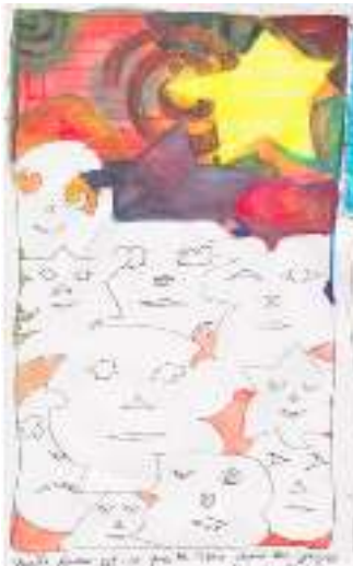
Illustration de Camille Maupas